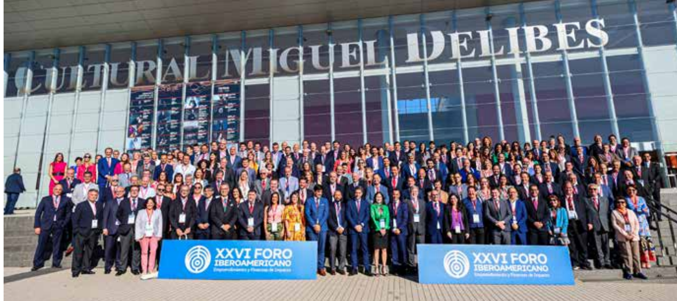
Asistentes al foro en las escaleras de acceso al Centro Cultural Miguel Delibes de Valladolid