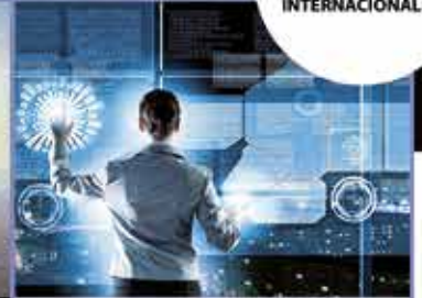
RECURSOS HUMANOS NOMINAS