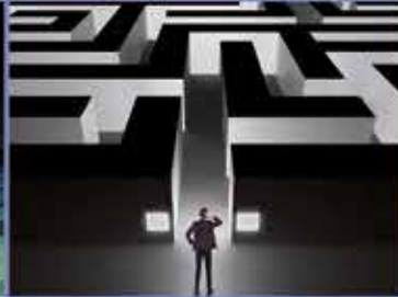
OUTSOURCING CONTABLE Y FISCAL