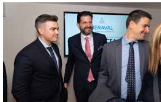
Representantes de las entidades financieras.