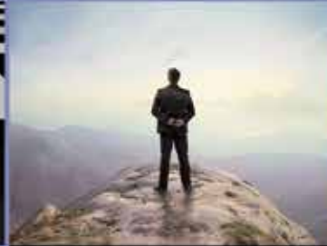
SERVICIOS DE AUDITORÍA