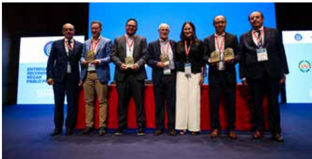
Fotografía de los distinguidos con los Premios «Pablo Pombo», los organizadores y los futuros encargados del Foro que tendrá lugar este año 2024, en Honduras.