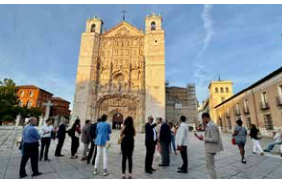
Plaza de San Pablo.

La delegación internacional presente en el Foro de REGAR quiso conocer la ciudad en la que tenía lugar el foro. Algunos de ellos ya habían recorrido sus calles en 2014, incluso en 2005, cuando tuvieron lugar los dos foros, en el formato actual, previos, que también aterrizaron en la ciudad castellano y leonesa, como punto de encuentro en España.