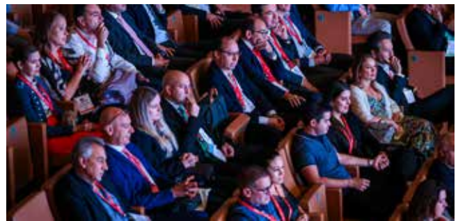
Imagen con algunos de los asistentes a la segunda jornada del encuentro, en la Sala de Cámara del recinto.