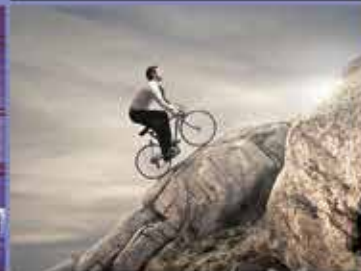
ASESORAMIENTO Y OUTSOURCING LABORAL