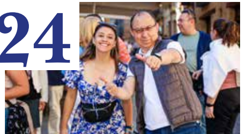
FORO DE REGAR