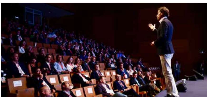
El conferencista Víctor Küppers se dirige a la audiencia en el transcurso del Foro

Autoridades locales y autonómicas, primeros espadas de la Economía, y conferenciantes de primer nivel dieron el nivel que merecía a esta cita, que regresaba a Valladolid por cuarta vez, tras las ediciones de 1998, 2005 y 2014.