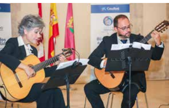
Carpe Diem Guitar Duet.