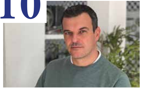
WELAB + IBERAVAL