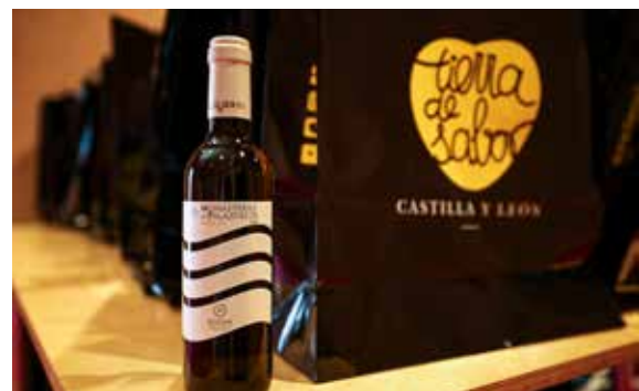
Tierra de Sabor y el vino de Bodegas de Alberto.