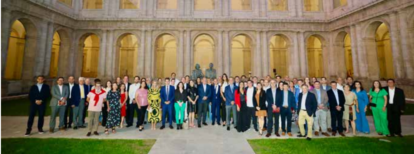
Foto de grupo en el claustro del Patio Herreriano.