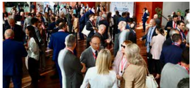
Un nutrido grupo de asistentes hace networking en el descansillo del Centro Cultural Miguel Delibes.