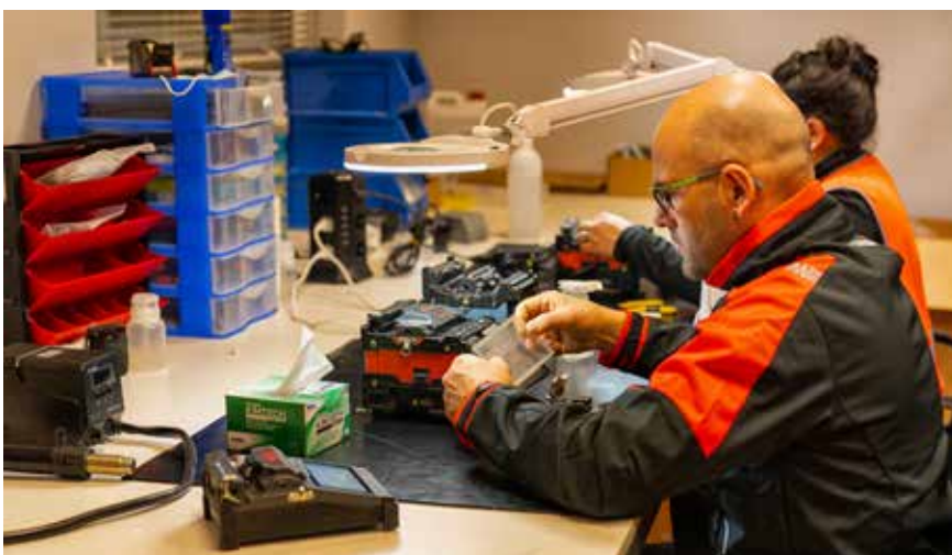
Un trabajador de Kyo Electric en las instalaciones de la compañía.

Más información en: https://www.kyoelectric.es/