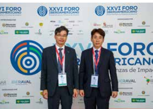
Dos participantes internacionales.