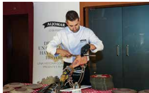
Cortador de jamones de Aljomar.

El foro tuvo participantes de más de una veintena de países