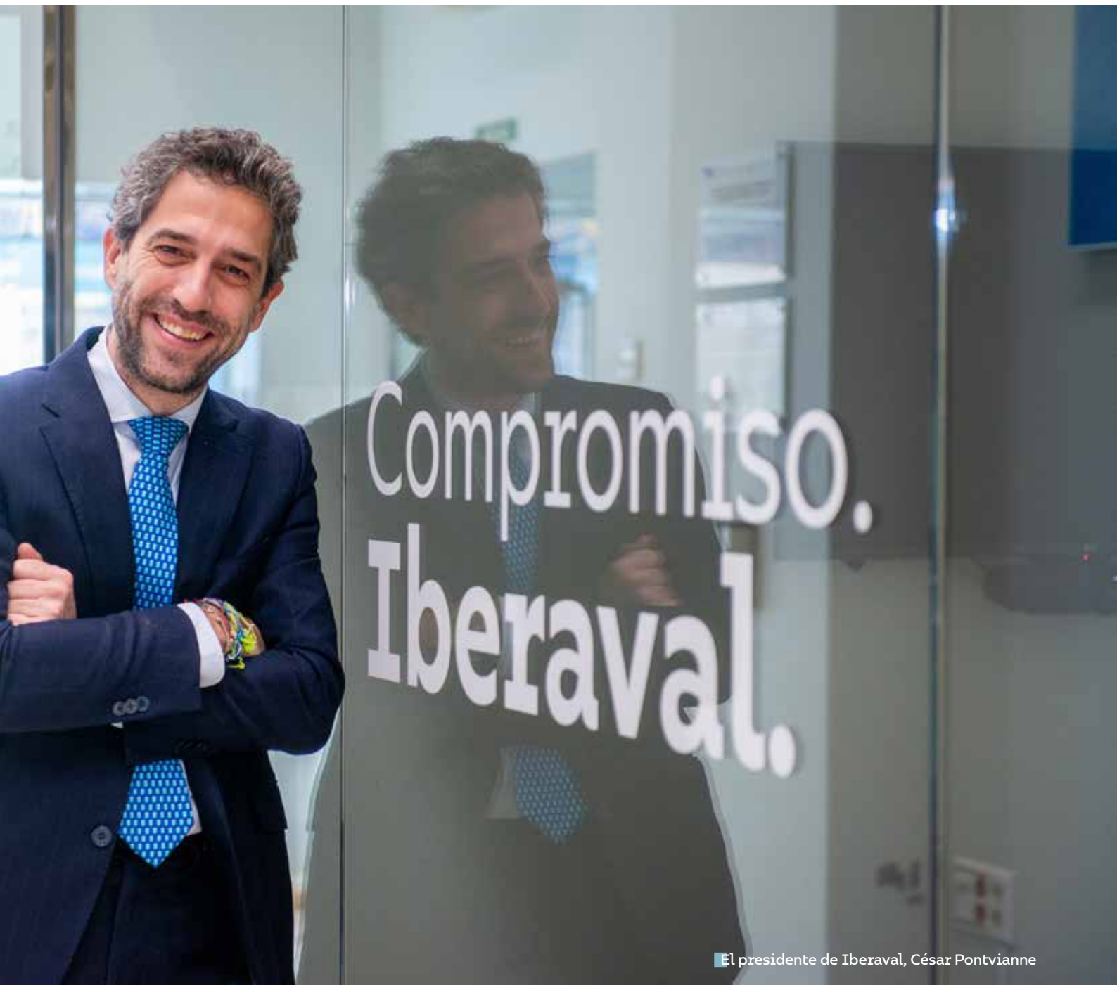
El presidente de Iberaval, César Pontvianne