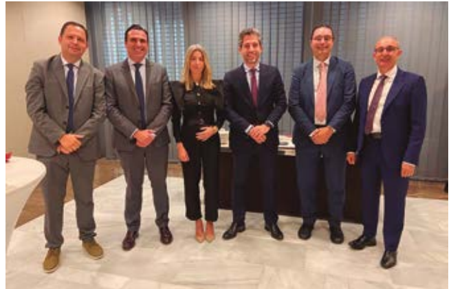
Representantes de Iberaval en el Foro Guadarrama de Castilla y León Económica

En dicho evento, organizado por la revista Castilla y León Económica , Pontvianne entregó una escultura conmemorativa a la