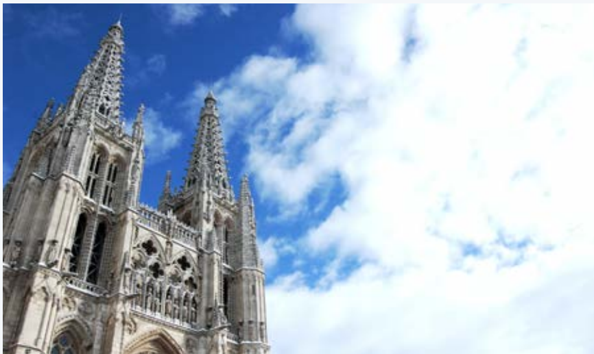
Los cielos de Burgos, rindiendo tributo a su espectacular Catedral

Cuenta con más de la mitad del patrimonio histórico-artístico de toda España y acapara una masa forestal envidiable. Entre sus hitos más relevantes se sitúan nueve bienes Patrimonio de la Humanidad , como son los cascos antiguos de Ávila, Salamanca y Segovia; la Catedral de Burgos, el Camino de Santiago Francés, Las Médulas, Atapuerca -cuna de los primeros habitantes europeos-, el yacimiento de arte rupestre de Siega Verde y los hayedos de Picos de Europa.