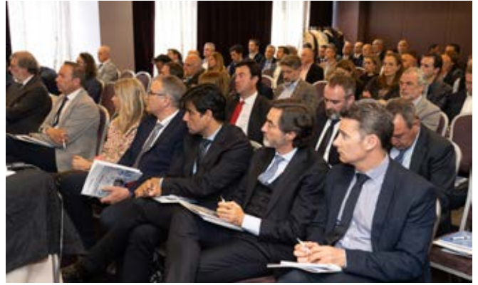
Asistentes a la Junta General de Socios

Son empleos ligados a empresas de todos los sectores. Y es que, precisamente esa, es una de las señas de identidad de la sociedad de garantía, que ha logrado posicionarse en el mercado nacional como la más activa y eficaz, en términos de productividad.