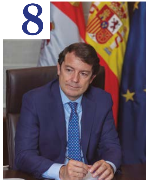
ALFONSO FERNÁNDEZ MAÑUECO