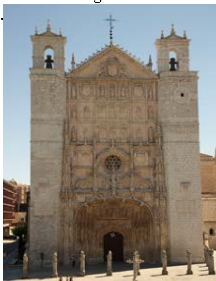
Fachada de San Pablo

Cada esquina de esta capital cuenta una historia. La Plaza Mayor , del siglo XVI, nos demuestra la grandeza de un lugar en el que también cobra vida el Museo Nacional de Escultura , que alberga una impresionante colección de esculturas religiosas de maestros como Gregorio Fernández o