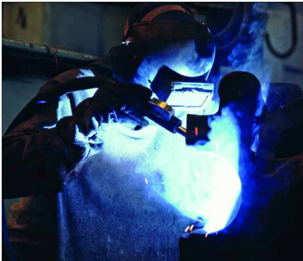
El sistema de garantía recíproca aspira a impulsar la creación de 6.000 pymes en España.

Iberaval ha renovado el contrato con la Compañía Española de Reafianzamiento (CERSA), dependiente del Ministerio de Industria, Turismo y Comercio, que contempla una partida de 400 millones de euros destinado a todo el sistema de garantía español para fomentar la creación de empresas y la inversión en innovación. El convenio, que cuenta con la coordinación del Fondo Europeo de Inversiones, pretende ampliar el número de pymes en 6.000 más en toda España, al tiempo que se ha marcado como objetivo colaborar en la resolución de los problemas financieros a largo plazo de las pequeñas y medianas empresas en proyectos con viabilidad.