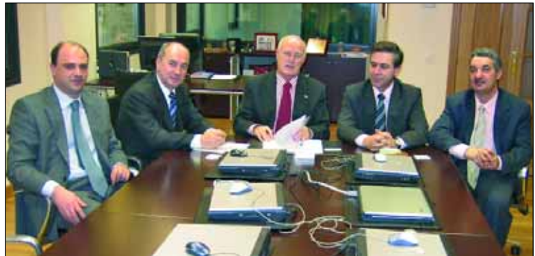
Responsables de Iberaval y la Fundación Michelin Desarrollo durante la firma del convenio.

Las solicitudes deberán presentarse en Iberaval, pero necesitarán un informe favorable de la Fundación. La SGR castellana y leonesa avalará estas operaciones de préstamo siempre que se cumplan con los criterios de viabilidad. Para coordinar la tramitación de las operaciones acogidas a este protocolo, se ha creado una Comisión de Seguimiento formada por dos miembros de ambas entidades.